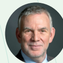
Jochen Flasbarth Staatssekretär im Bundesministerium für Umwelt, Naturschutz und nukleare Sicherheit

Wir wünschen viel Freude bei der Lektüre und freuen uns auf den weiteren Austausch.