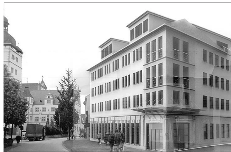
Die Bank für Kirche und Caritas erhält mit dem Neu- und Ausbau am Kamp ein völlig neues Gesicht. Seit Freitag wird gebaut.

Den Gewinn vor Steuern beziffert Böger für 2008 auf 15,7 Millionen Euro. 1333 Kunden (Kirchengemeinden, caritative Einrichtungen sowie Privatpersonen) haben der Bank 2,8 Milliarden Euro Einlagen anvertraut. In 2008 hat die Kirchenbank sieben Prozent Dividende ausbezahlt. Die Prozentumsfreudige Genossenschaftsbank ist über die Grenzen des Erzbistums hinaus tätig. In Deutschland bestehen fünf Kirchenbanken.